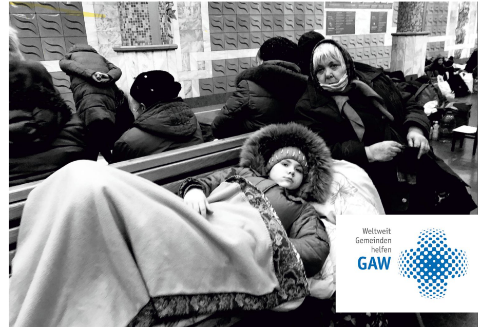
Foto: Menschen bringen sich in der Metro in Charkiw in Sicherheit.

Du kannst etwas tun! HILFE FÜR MENSCHEN IN DER UKRAINE