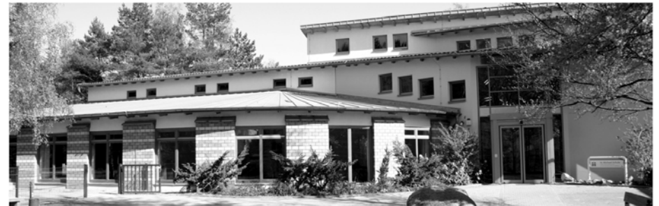
Die finanzielle Kürzung trifft die Schwächsten unserer Gesellschaft. Die St. Michael-Schule muss künftig mit 22 Prozent weniger Budget für das Personal auskommen.

Die Landesregierung streicht Personalkosten bei freien Schulen