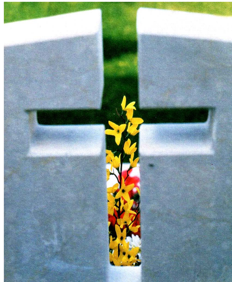
„Durch das Tor des Todes – ins Leben“