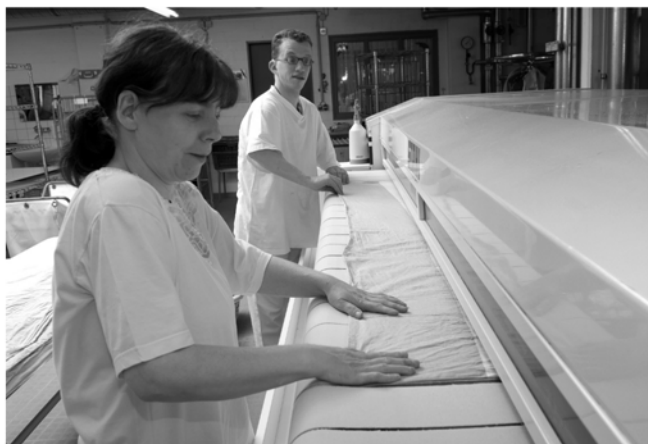
Mit steigendem Wäscheaufkommen ist auch der Platzbedarf der Wäscherei gestiegen.

Übrigens wurden im vergangenen Jahr die alten dampfbetriebenen Wäschetrockner gegen drei neue erdgasgefeuerte Trockner ausgetauscht. Diese arbeiten deutlich schneller und effizienter.